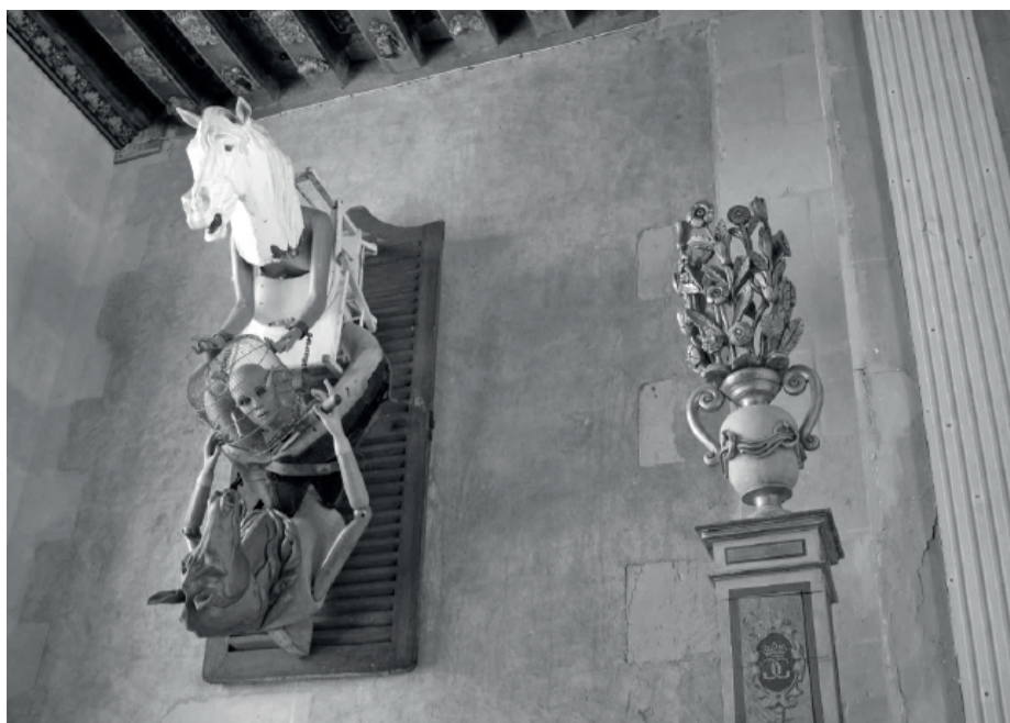
Daniel Spoerri : Salle d'Armes, Les corps en morceaux , de l'artiste Daniel Spoerri. Commande publique, collection CNAP, inventaire FNAC.

Et pour commencer, une journée de balade sur le thème des monuments singuliers est organisée le 24 octobre avec la visite du château d'Oiron et de l'abbaye de Fontevraud